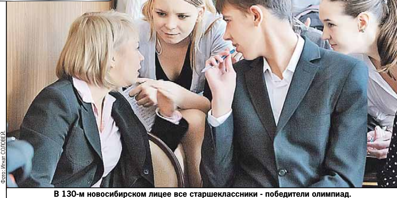
В 130-м новосибирском лицее все старшеклассники - победители олимпиад.

Программа «Образование и работа» сегодня в 14.00