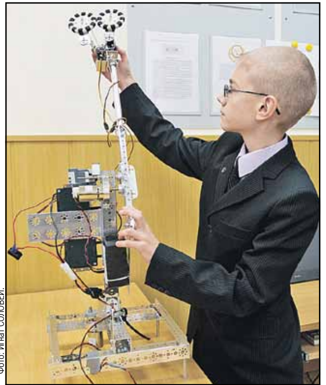
Этот юный талант уже учится в девятом классе и теперь «дрессирует» робота.

нах участники получают ценные призы... А наши - диплом и льготу на поступление в вуз, куда их и так бы взяли.